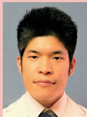
津島市民病院 消化器内科医師