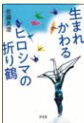
『生まれかわる ヒロシマの折り鶴』 佐藤真澄 著 汐文社

被爆地・広島には、幼い頃の被爆が原因の病気で亡くなった少女の死をきっかけに、毎年たくさんの折り鶴が捧げられるようになりました。