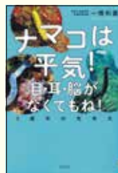
『ナマコは平気! 目・耳・脳がなくてもね!』 一橋和義 著 さくら舎

珍味としても知られるナマコ。海の底に生息しているナマコはヒトと違い、目や耳だけでなく、なんと脳すらありません。しかも触られると皮膚を硬くし、ストレスを感じると肛門から内臓をすべて吐き出します。