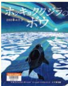
『ホッキョククジラのポウ 200年のたび』 アレックス・ボースマ 作 絵 ニック・バイエンソン 作 小学館

一生を北極海とその近くで過ごすホッキョククジラは、哺乳類のなかでいちばん長生きし、200年もの長い時間を生きるといえます。