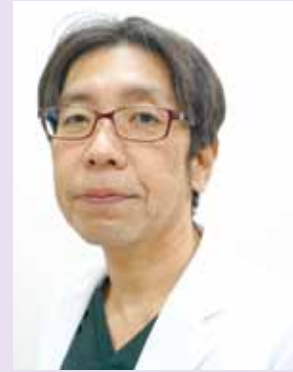
津島市民病院 循環器内科部長