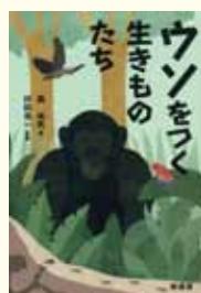
『ウソをつく生きものたち』 森 由民 著 村田浩一 監修 緑書房

人間と違って他の生きものはウソをついたり、誰かを騙したりしないと思っていませんか？