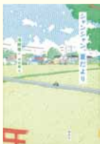
『シャンシャン、夏だより』 浅野 竜 作 中村 隆 絵 講談社

シャンシャンシャンシャンシャン……と大きな声で鳴くクマゼミ。小学6年生のノブにとっては特にめずらしくもない虫だが、転校生のちとせの言葉で、千葉の町にはめずらしい存在であることに気づく。セミによって生息域がちがうことを知ったノブは、くわしく調べるために図書館へ行き、そこで地球温暖化が原因でクマゼミの分布が広がりつつあることを知る。そこで、ノブはこの町にもクマゼミがいることを証明し、それを自由研究として発表すれば賞がもらえるのではないかと考え、夏休み中、クマゼミを探しまわることにした。クマゼミの研究を通して12歳の子どもの心情を描いた、ひと夏の物語。