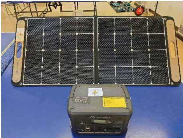
◀ポータブルソーラーパネル