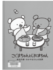
『こぐまちゃんとしろくまちゃん』絵本作家・わかやまけんの世界 世田谷美術館(ほか) 編集 中日新聞社

ロングセラー絵本「こぐまちゃん」シリーズが誕生から50年を迎えました。本書は、作者であるわかやまけん創作の全貌を紹介する初めての展覧会の図録です。初公開を含む展示を通して、今もなお愛され続けている「こぐまちゃんとしろくまちゃん」の色あせることのない魅力と創作の過程がわかる内容となっています。他にも、代表作「おぼけのどろんどろん」シリーズなど約30冊の絵本のリトグラフや原画、雑誌など、約230点が掲載されています。半世紀にわたり世代を超えて親しまれている、わかやまけんの世界をお楽しみください。