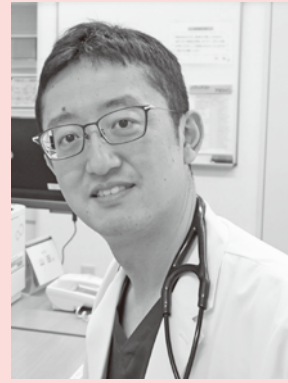
津島市民病院 循環器内科医長