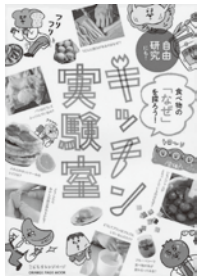
『キッチン実験室』 オレンジページ

「なぜパンはふわふわなの？」 「なぜジャムはプルプルなの？」 よく食べている身近な食材でも知らないことがたくさんあるものです。膨らんだり、固まったり、料理によって姿や形を変える食材の様子を観察すると、驚くような科学のふしぎに出会えます。この本には、そんな食べ物の「なぜ？」を実際に自分で調理しながら解き明かしていくレシピや実験方法が紹介されています。どれもおうちで簡単に実践することができ、作った後にはおいしく食べられるものばかりです。興味のあるテーマを見つけたら、ぜひ挑戦してみませんか？