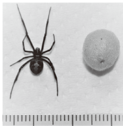
▲セアカゴケグモ(メス、背面)と卵嚢【1目盛=1mm】

素手で捕まえたり触らないようにして、成虫の場合は市販の殺虫剤（ピレスロイド系）を噴射し、卵嚢は踏み潰す等してください。