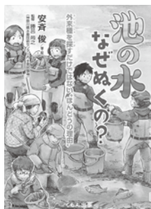
『池の水なぜぬくの?』 安斉 俊 著 絵 勝呂尚之 監修 くもん出版

池の水を全部抜いてしまうテレビ番組を観たことがありますか。実はこういった大きな作業をするには、事前に目的や計画を立て、さらに調査・記録といった準備をする必要があります。この本は池の水抜きという作業から分かる生態と、その環境についてくわしく解説した内容となっています。