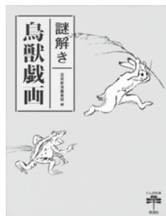
『謎解き鳥獣戯画』 芸術新潮編集部 編 新潮社

『鳥獣戯画』は、甲乙丙丁の四巻で構成された平安時代の絵巻物です。本書は各巻の謎と、その魅力について分析し、詳しく解説した内容となっています。