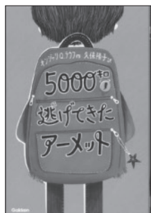
『5000キロ逃げてきたアーメット』 オンジャリQ.ラウフ 作 久保 陽子 訳 学研プラス

ある日、アレクサのクラスにひとりの男の子が転入してきました。彼は、誰とも話さず、笑わず、遊びません。アレクサは彼と友だちになるうといういろいろな作戦を試しますが、うまくいきません。ついには生徒たち間でさまざまな噂が飛びかい、いじめまで起こります。実は、彼がそんなふるまいをするのには大きな理由がありました。彼は、中東シリアからはるばるロンドンまで逃げてきた難民だったのです。たどり着くまでの出来事を知ったアレクサは、彼のためにいろいろと行動に移します。