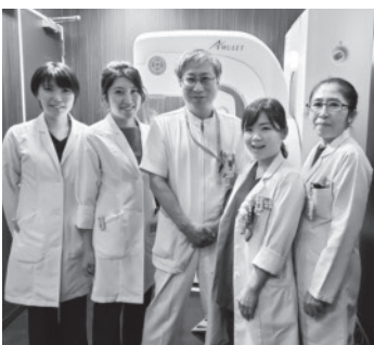
▲検診マンモグラフィ撮影認定診療放射線技師と外科医師