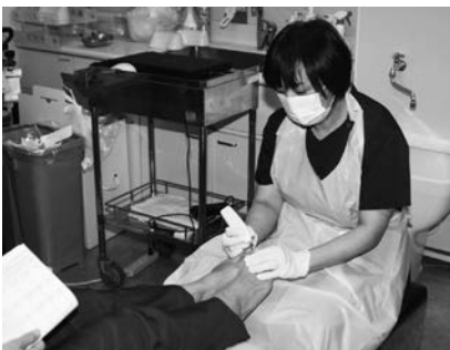
▲フットケアの様子