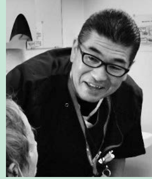
津島市民病院 脳神経外科