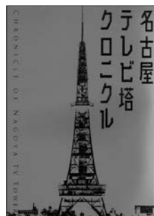
『名古屋テレビ塔クロニクル』 名古屋テレビ塔株式会社 監修 人間社

今年、開業65周年を迎える栄のシンボル・名古屋テレビ塔。本書は、建設前から現在までのテレビ塔の歴史を詳しく紹介するほか、名古屋出身の著名人が思い出を語るインタビューや、テレビ塔グッズも掲載。テレビ塔、そして昭和の時代を懐かしく振り返ることができます。