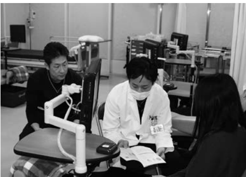
▲抗がん剤治療について説明している様子