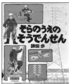
『そらのうえの そうでんせん』 鎌田 歩 作 アリス館

地面から50メートル、20階建てのビルくらいの高さの鉄塔のてっぺんに上って、送電線を点検する作業員のことを「ラインマン」といいます。この絵本は、まるで忍者のように1本の送電線の上をスルスルと移動しながら、点検や部品交換を行う「ラインマン」の仕事を知りやすく教えてくれます。