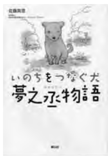
『いのちをつなぐ犬 夢之丞(ゆめのすけ)物語』 佐藤真澄 著 静山社

人に見捨てられ、広島県動物愛護センターで、ふるえながら処分を待っていた一匹の子犬「夢之丞」。