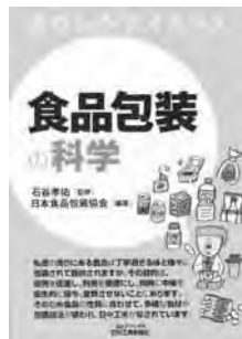
『食品包装の科学』 日本食品包装協会 編著 日刊工業新聞社

私達が、お店から購入してきた品物を見る時、「なんと!丁寧すぎる包装なんだ」、「包装が多くて、ゴミが増えて仕方ない。資源の無駄使いではないか」と思ったりしませんか?