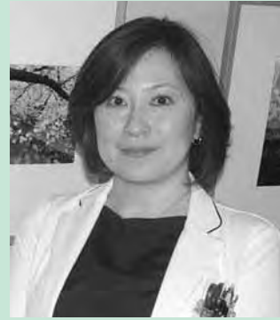
津島市民病院 形成外科医師