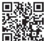
▲つしま防災ポータル

地域にどのような災害リスクがあるのかを災害が発生する前に、日ごろから確認しましょう。また、ハザードマップはつしま防災ポータルからも確認できます。