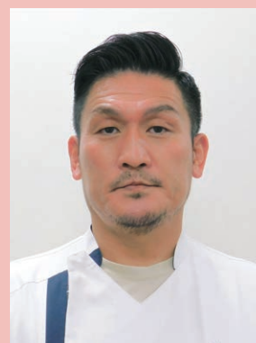
津島市民病院 外科部長