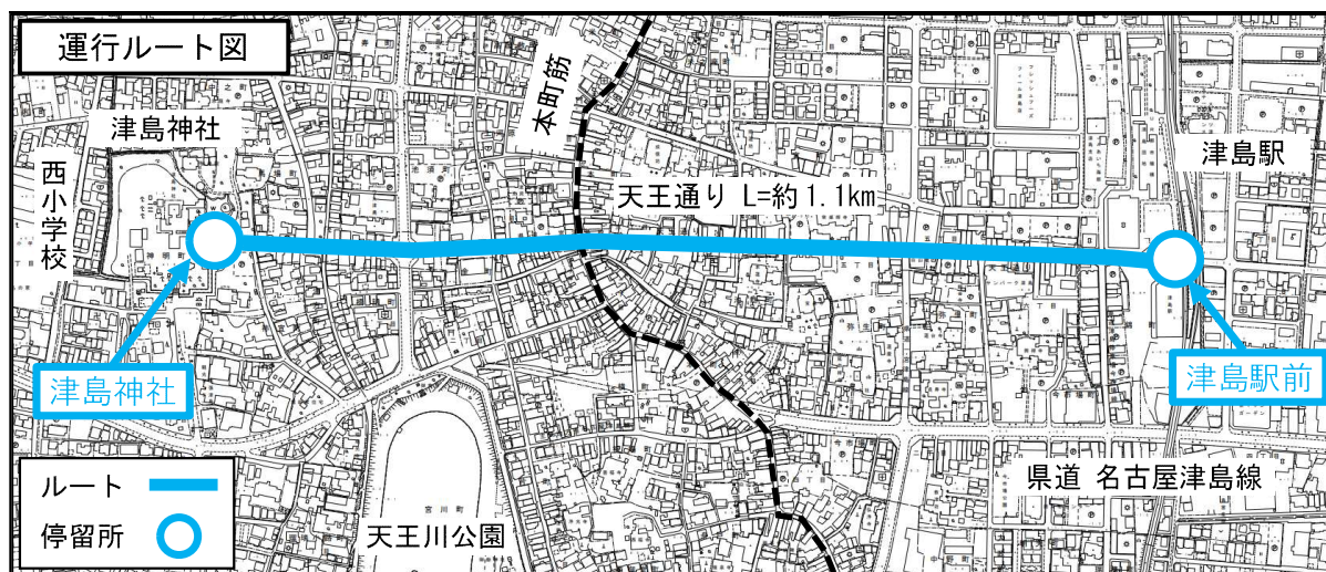
図 運行ルートと周辺施設