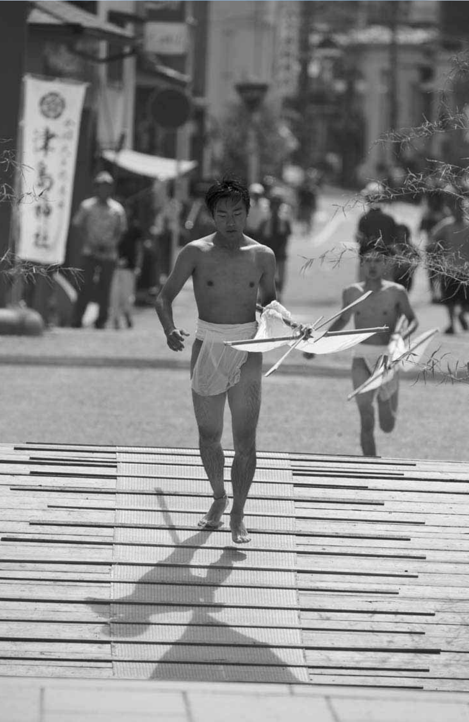
2015 REDISCOVERY TSUSHIMA 写真コンテスト入賞作品 優秀賞