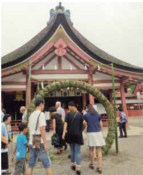
夏越の大祓(茅の輪くぐり)

議場改修工事のため、開会(8月29日)、一般質問(9月5日～7日)、閉会(9月29日)は同市役所5階の委員会室に場所を移して開催します。この議場改修工事は傍聴席およびトイレをバリアフリー化するものです。ご迷惑をおかけしますが、ご協力をお願いします。