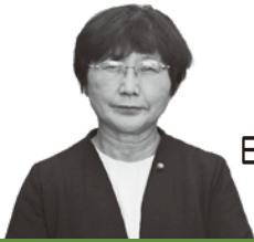
日本共産党議員団 太田 幸江