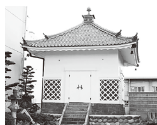
▲津島市文化財の輪転式経蔵

令和6年度から津島市文化財保存活用地域計画の策定作業に着手、3カ年で計画を策定し、文化庁の認定を得る予定。市域内にある指定・未指定を問わず、多様な文化財を保存活用することにより、地域振興に資するとともに確実な文化財の継承につなげていく。