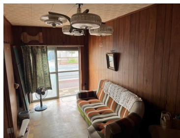
レトロな雰囲気も活かしたい！←