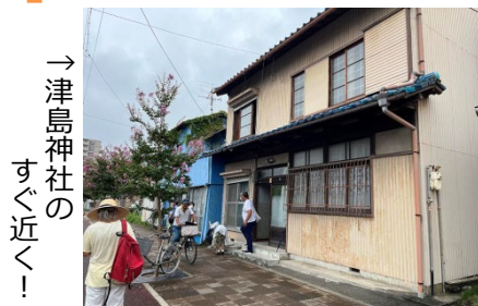
→津島神社のすぐ近く！

前回決めた、南門前町にある「おためし縁側」の候補＝空き家をみんなで見学しました。