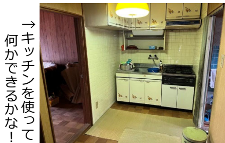
→キッチンを使って何かできるかな！