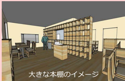
大きな本棚のイメージ