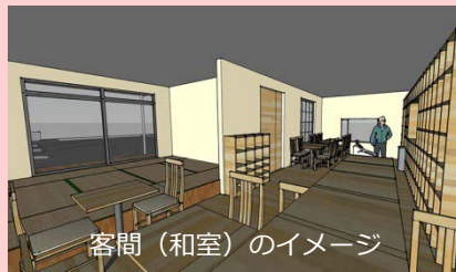
客間（和室）のイメージ