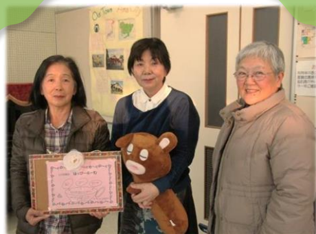
精神保健福祉ボランティアグループ 風車の会のみなさんとマスコットキャラクターのはっぴーちゃん