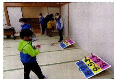
📷 昨年度わかがえり教室の写真健幸塾は初の試みでしたが、沢山の方に参加いただきました！