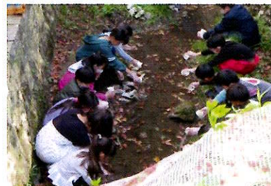
🦋 蛍放流の様子です。児童の皆さん、ありがとうございます！