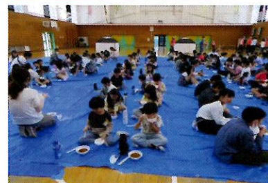
🍳 西小炊き出し訓練の様子です。女性の会は豚汁、PTAの方たちに白米を炊いていただきました。